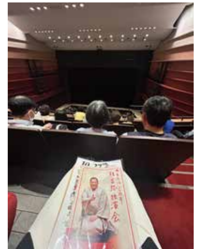
6/8 吉弥さん30周年落語鑑賞