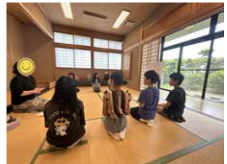
6/1 ど〜なつクラブ茶道