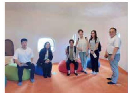
7/18 立憲民主党青年委員会おにクル見学「おはなしのいえ」