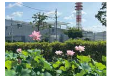
平田台花・水・木の小径