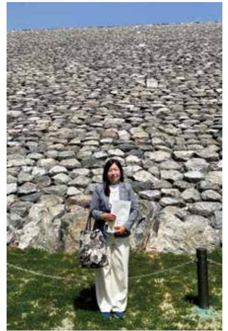
4/17 ダムパークいばきた現地視察