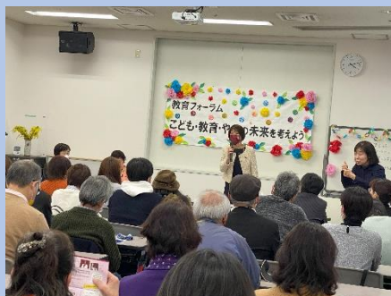
子ども・教育フォーラム